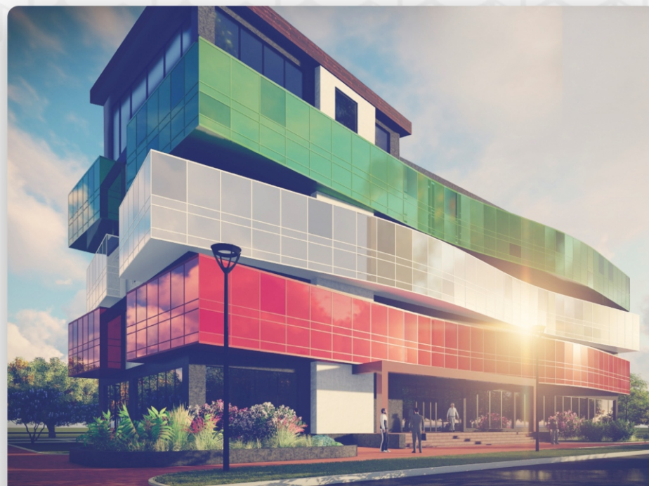
ПРОМЫШЛЕННЫЙ КОМПЛЕКС 30 000 м 2 и АБК 4000 м 2