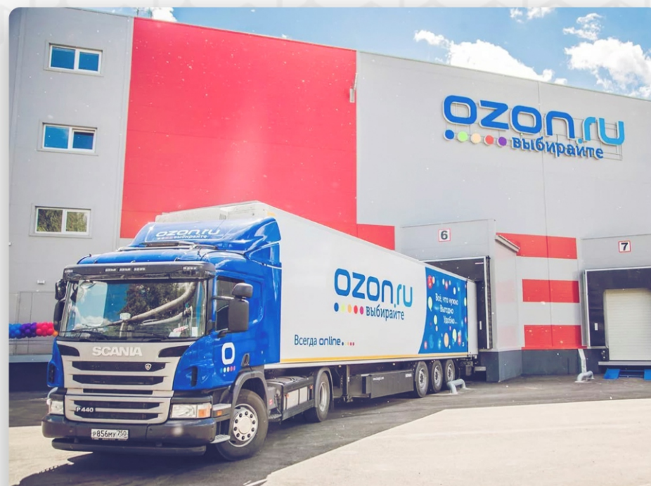
ЛОГИСТИЧЕСКИЙ КОМПЛЕКС OZON, г. Зеленодольск. 20 000 м 2