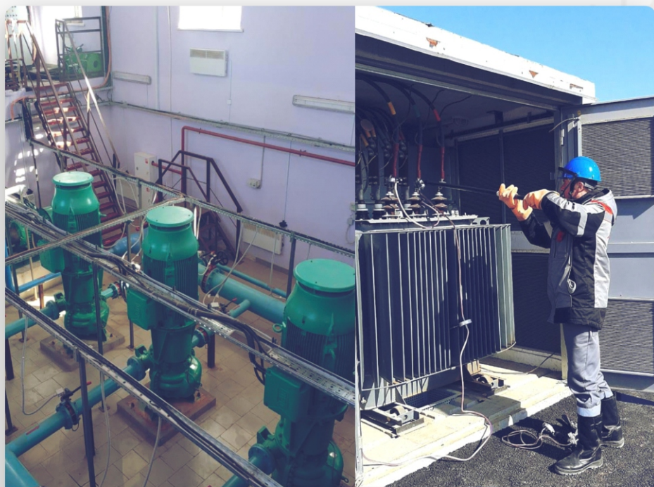
РЕКОНСТРУКЦИЯ ИНЖЕНЕРНЫХ СЕТЕЙ, Индустриальный парк, г. Зеленодольск