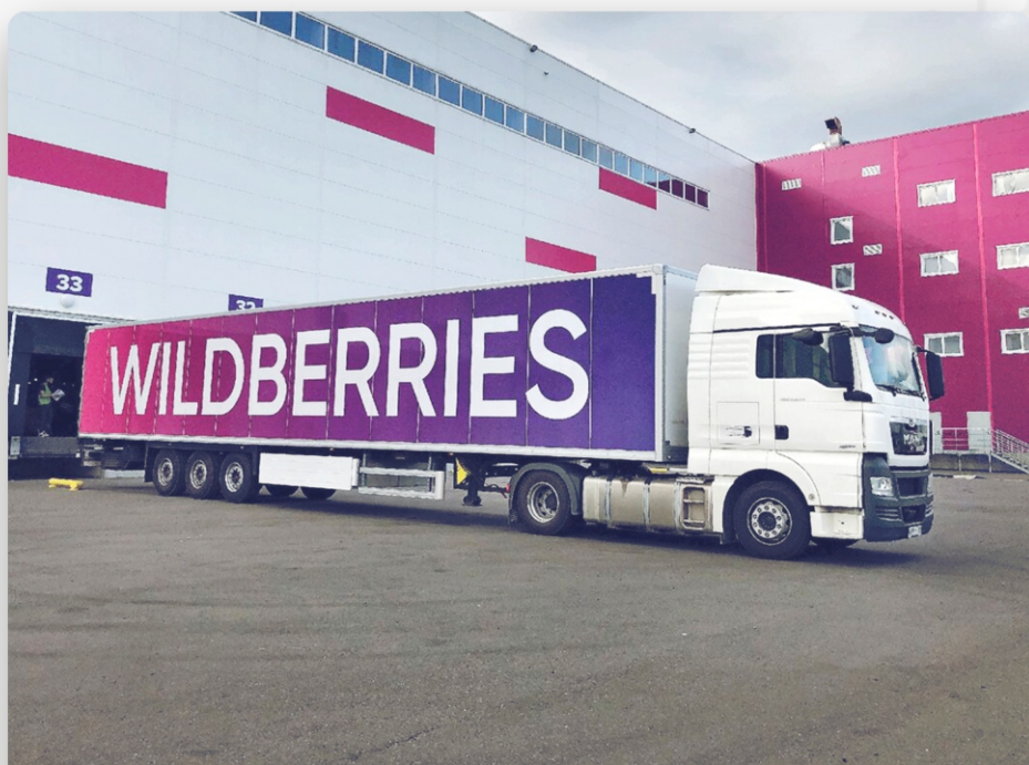
ЛОГИСТИЧЕСКИЙ ЦЕНТР WILDBERRIES, г. Зеленодольск. 100 000 м 2