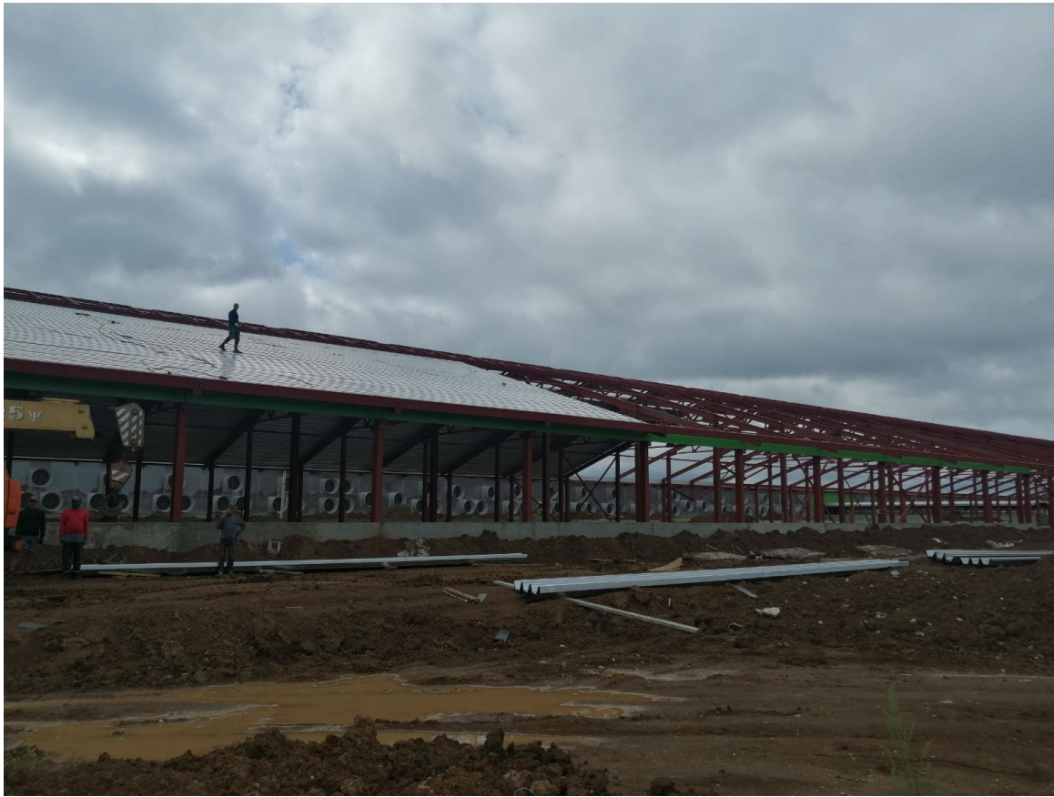
«Молочно-товарная ферма на 3400 коров», расположенная по адресу: РТ, Кайбицкий МР, вблизи с.Ульянково